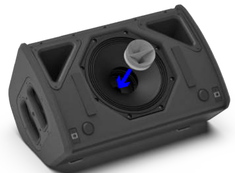
Une fois la grille retirée, un pavillon magnétique optionnel peut rapidement être installé de manière à changer la directivité pour passer de 100° x 100° à 110° x 60°

La réponse en phase de l'enceinte P8 est la réponse signature de NEXO, permettant une compatibilité avec toutes les autres enceintes NEXO (sauf les configurations de retour de scène dont la latence est réduite).